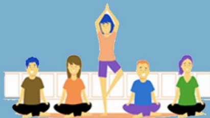
ATELIER ACTIVITE PHYSIQUE