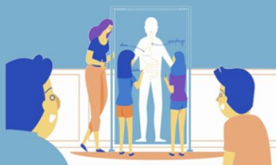
ATELIER COMPRENDRE MA MALADIE