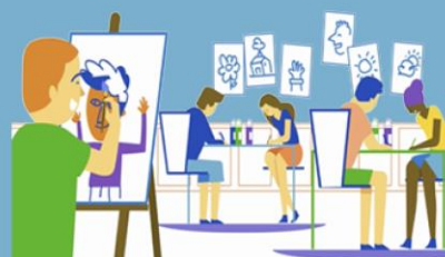
ATELIER THERAPIES COMPLEMENTAIRES