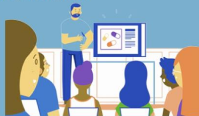
ATELIER ETRE A L'AISE AVEC MON TRAITEMENT